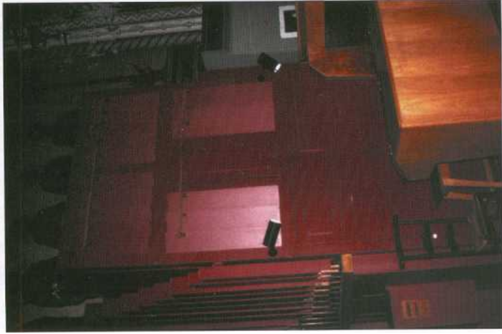
Orgue - Service Communication